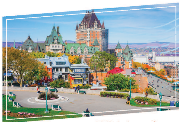
魁北克市 Quebec City

素有“北美小巴黎”之稱，融合歐洲傳統與北美現代城市的風貌；世界第二大法語城市，洋溢歐陸風情，盡顯加國第二大都市的繁華與精彩。